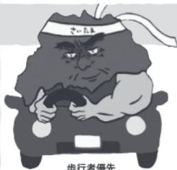
歩行者優先 イメージキャラクター 「さいたまお父さん」