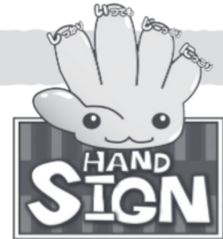
道路横断時の安全行動 イメージキャラクター「サイン(SIGN)ちゃん」