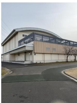
なぐわし公園建物