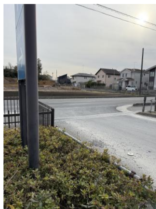
なぐわし公園出口